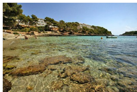
Blau Porto Petro, Mallorca

Muchas gracias a todos que organice el seminario y que lo hizo tan especial. Esperamos con mucha antelación el siguiente seminario 2010.