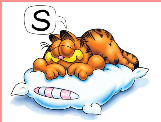
Garfield sabe dormir